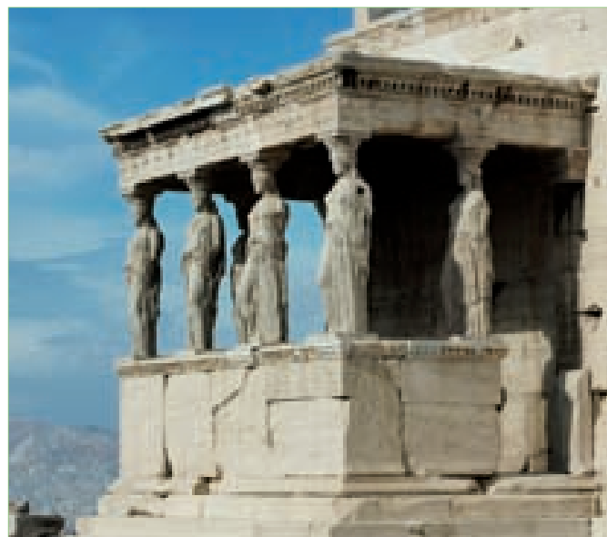
Templo de Atenea Poliada o Erecteion. Detalle de la galería sur o Tribuna de las Cariatides (2 m de altura). Acrópolis de Atenas.

Luego imagina y describe una utopía que recoja un mínimo de seis de estos elementos.