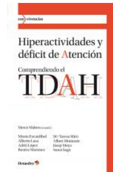
Educación infantil Hiperactividades y déficit de atención Mercè Mabres Boix, Mireia Escardíbul Ferrà y otros