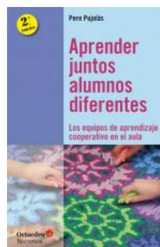
Educación Aprender juntos, alumnos diferentes Pere Pujolàs i Maset